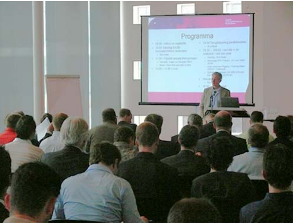
1e consultatiebijeenkomst 25 september 2007 Beatrix Theater Utrecht